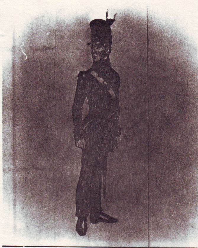
Hauptmann Heinrich Christian Ruhe, Lochtum,

1.10.1816 - 5.4.1826 ausgeschieden als Hauptmann und Kommandant des Depots im 4. Landwehr - Bataillon in Salzgitter